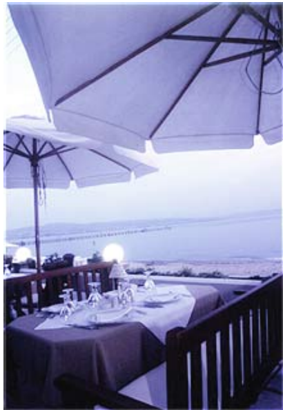
Golden Star Hotel***